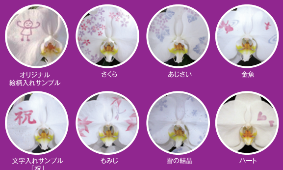
オリジナル 絵柄入れサンプル