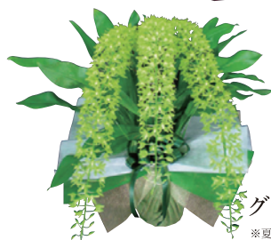
グラマトフィラム(3本立)