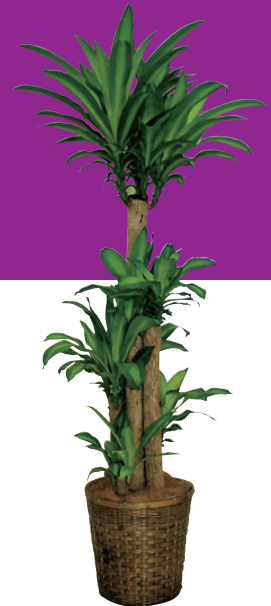
幸福の木(8号・10号鉢) 販売価格(税別) 【8号】¥10,000 【10号】¥15,000