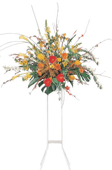
※サンプル写真の商品