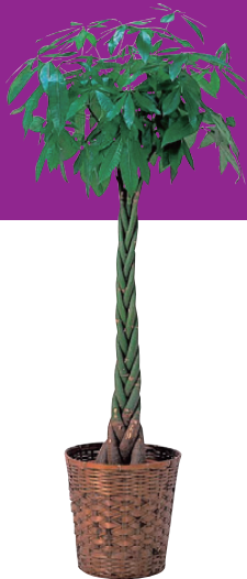
パキラ(8号・10号鉢) 販売価格(税別) 【8号】¥10,000 【10号】¥15,000