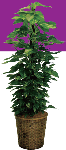
ポトス(8号・10号鉢) 販売価格(税別) 【8号】¥10,000 【10号】¥15,000