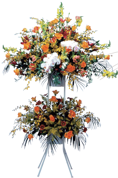
祝スタンド花(1段・2段)

販売価格(税別) 【1段】¥15,000 ¥20,000 【2段】¥20,000 ¥25,000 ¥30,000