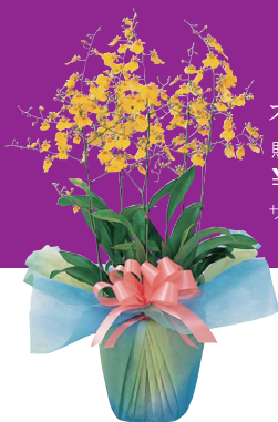
オンシジューム(5本立)