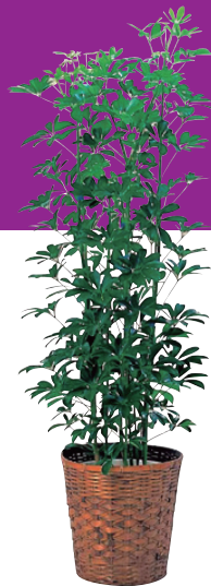
カポック(8号・10号鉢) 販売価格(税別) 【8号】¥10,000 【10号】¥15,000